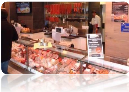
Pilotierung von HANDELkompetent in der Metzgerei Sack (Karlsruhe)

Wir laden Sie ein, die Ansätze und die damit bereits gewonnenen Erfahrungen und Erkenntnisse am 18. April 2018 in der IHK Köln näher kennenzulernen. Die Veranstaltung bietet Ihnen die Möglichkeit zu erfahren, wie Sie die Lösung auch in Ihrem Unternehmen zum Einsatz bringen können.